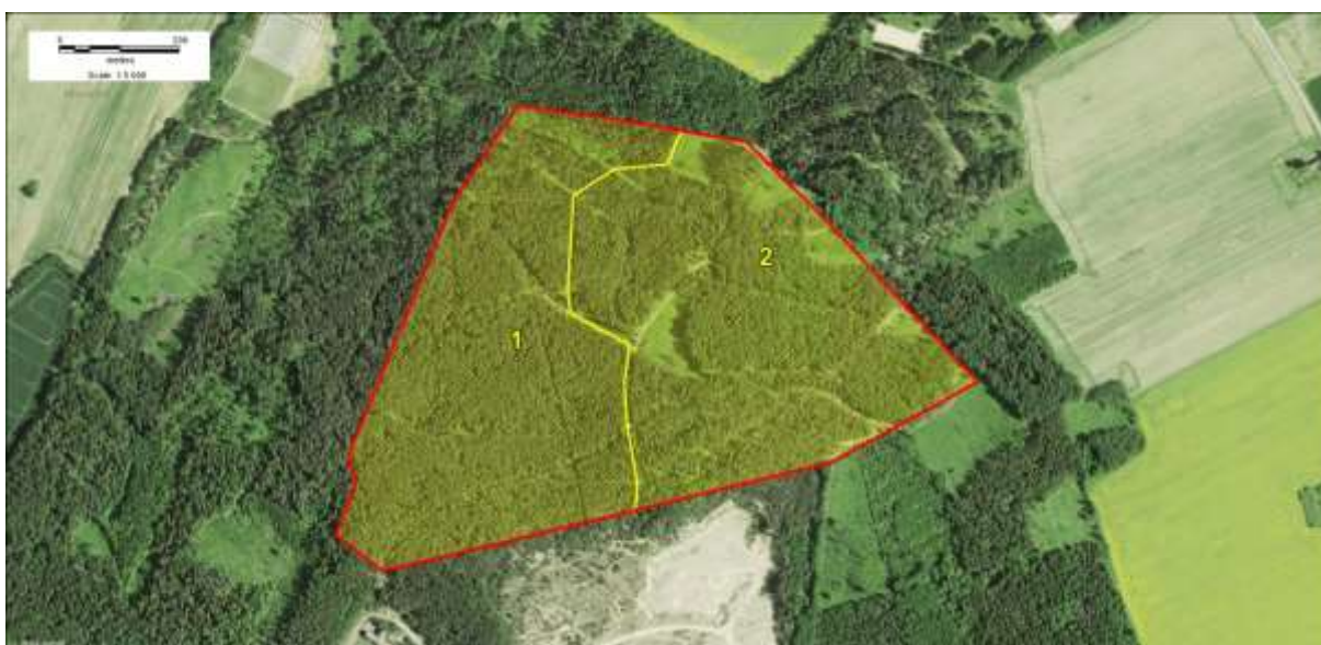
Joonis 3. Looduse pakutavad hüved käesoleva ettepaneku aluseks oleva kohaliku omavalitsuse tasandil kaitstava loodusobjekti, Vooremäe kaitseala (piiritletud punase piirjoonega) piires. Potentsiaalselt pakutavate looduse hüvede erineva kombinatsiooni ja eelisjärjestusega alad on toodud kollase viirutusega ja markeeritud numbriga, mille kirjeldus on toodud ptk tekstis.